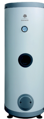
Zasobnik c.w.u. 220 l.

wys.: 125 cm szer.: 61 cm głęb.: 74 cm waga: 140 kg